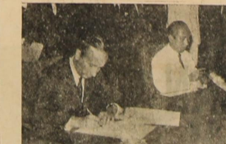
SELASA pagi kemarin, bertempat di Depu Mentu Adam Malik dan Dubes Canada A.P. Bismout telah menandatangani nota bantuan-pangan dari Canada kepada Indonesia sebesar 2 juta dollar Canada. (Foto 1 Indopis)

saikan pemilu sesuai dengan ketentuan MPRS No. XLII/1968 dan Keputusan MPRS No. XLII/1968. Hal ini berarti bahwa pemerintah akan menunda pemilu jika UU Pemilu belum diundangkan pada tanggal 5 Januari. "Pemerintah akan menunda pemilu jika UU Pemilu belum diundangkan pada tanggal 5 Januari," kata Menteri Dalam Negeri, Soedarto.