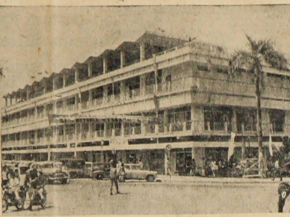
USAT pertokoan Pasar Baru Selasa-malam direseikan oleh Gubernur Ali Sadikin. Pembangunan pertokoan tsb diawasi oleh perusahaan pembangunan Pa. Harco.

Djakarta, (IPM) — Of course, kising is an import from the West. Demikianlah sebuah poster besar di Bombay (lihat gambar). Benarlah pertjuman itu merupakan kebiasaan yang diimport dari Barat?