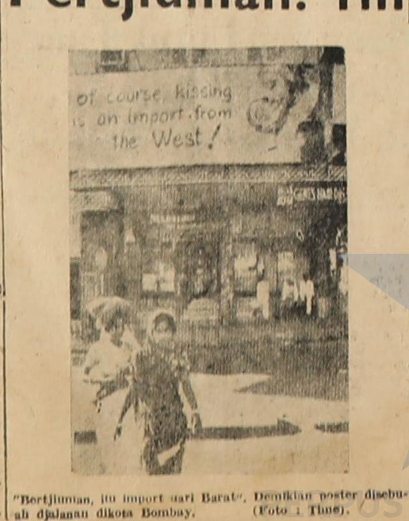
"Bertjuman, itu import dari Barat". Demikian poster disebut di jalanan dikota Bombay.